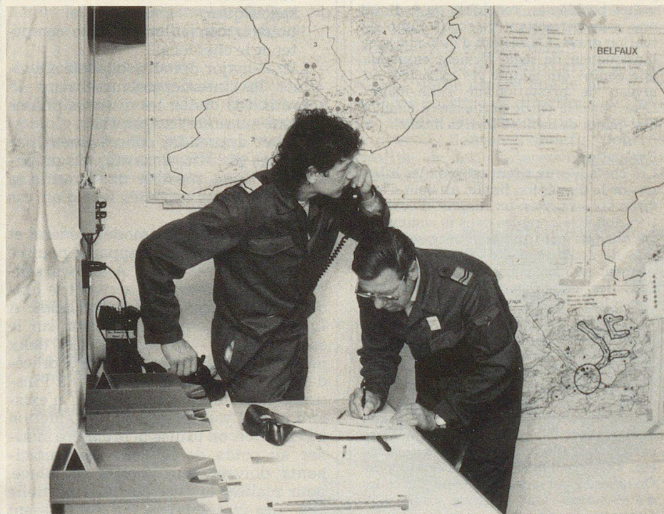
Objets Avanti. L'obtention de renseignements lors d'un sinistre.