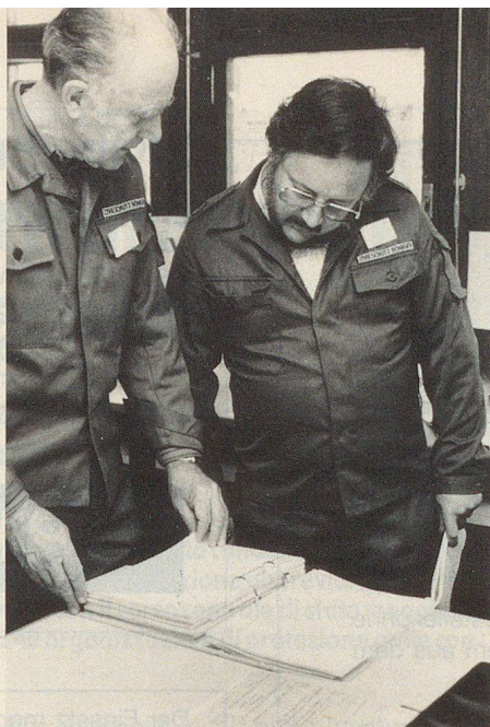
Après un événement. Le chef local et un chef de service apprécient ensemble la situation.

Cette transformation du «combattant solitaire» qu'est le chef local en un chef qui dirige une équipe a été notée par la plupart des états-majors.