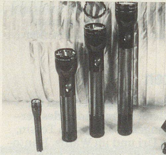
Les nouvelles lampes-torches halogènes des Etats-Unis: MINI-MAG LITE, MAG LITE, MAG CHARGER (de gauche à droite).

Le système MAG CHARGER se compose d'une lampe torche, d'une fixation pour la recharge (y compris la plaque murale, montable n'importe où), d'un câble de recharge de 12 V avec prise pour allume-cigares et d'un bloc d'alimentation réseau en 220 V. Rechargeable aussi bien sur un véhicule que sur le réseau, cette lampe est toujours disponible avec sa