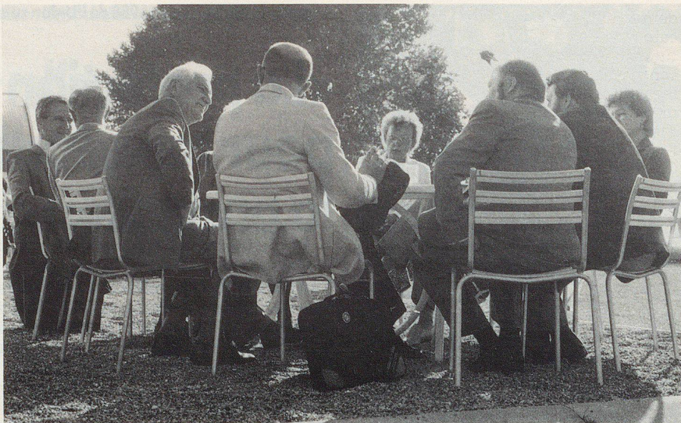
Après la partie officielle: échanges d'idées en plein air et sous un ciel radieux.