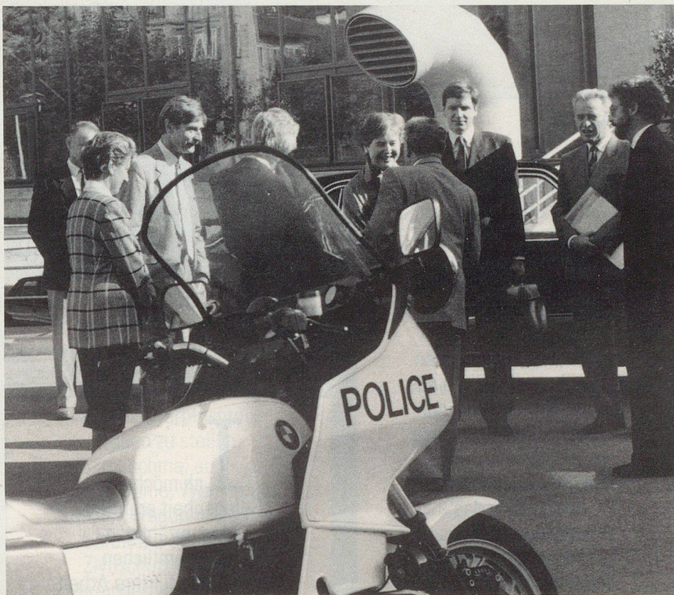
L'Assemblea dei delegati 1988 all'insegna del sole: all'inizio conversarsi ben protetti davanti al centro dei congressi dell'Università di Neuchâtel.