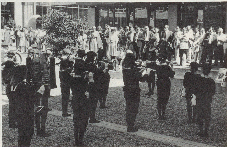
Dopo l'AD, durante l'aperitivo, suona la banda «Les Armourins».