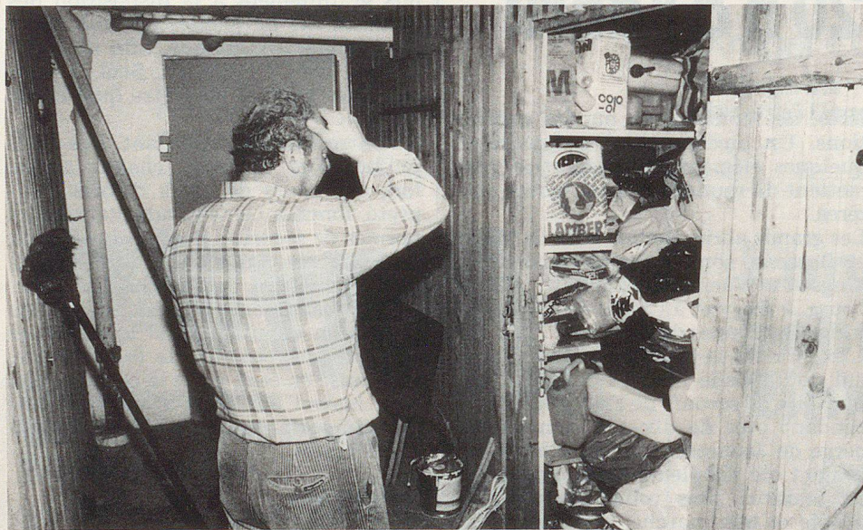
Quand les abris deviennent des remises (Stolz).

La protection civile fait preuve d'une grande tolérance à l'égard des propriétaires d'abris à l'imagination débordante. Elle exige toutefois que l'abri puisse être rendu à sa fonction initiale en 24 heures. ▀