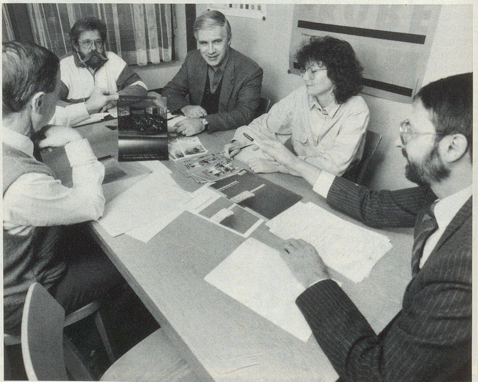
Redaktionskonferenz beim Bundesamt für Zivilschutz.