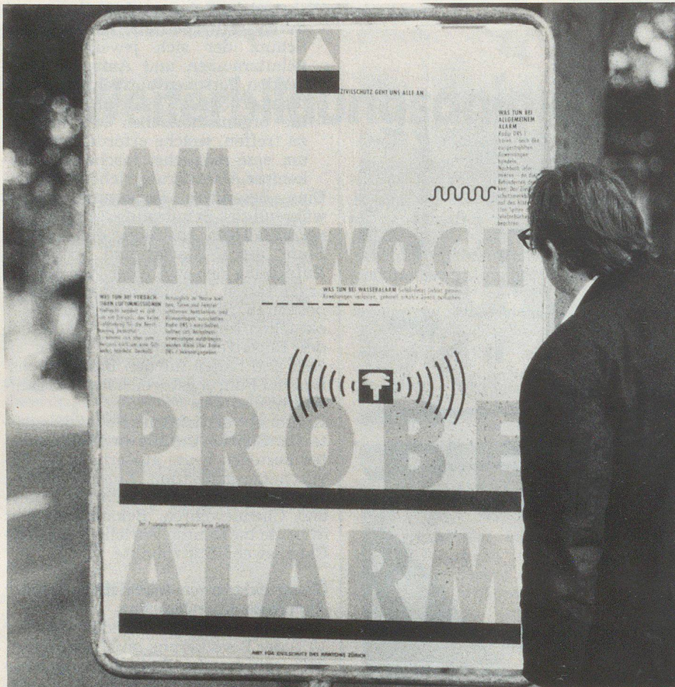
Das auffällige, modern gestaltete Plakat spricht zwei verschiedene Zielgruppen an. An den fahrenden Verkehrsteilnehmer richtet sich der sehr gross geschriebene, leicht lesbare und lediglich aus vier Worten bestehende Hinweis «Am Mittwoch Probe-Alarm». Damit ist eine optimale Information ohne Ablenkung der Fahrzeuglenker sichergestellt. Der Fussgänger wird in deutlich kleinerer Schrift an die Bedeutung der Alarmierungssignale und das richtige Verhalten erinnert.

eigentümern gerade noch einen Dienst und erhalten auch Gelegenheit, den Einwohnern den einen oder anderen Hinweis und Tip zu geben.