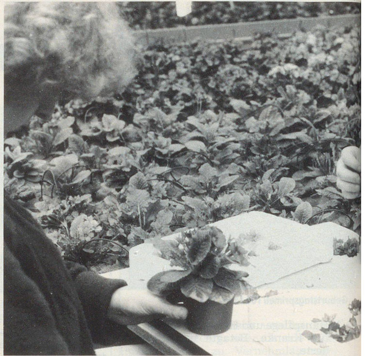
Le bouquet d'anniversaire des 100 ans de la SUPFS.

ush. Les 3 et 4 mai 1988, la Société d'utilité publique des femmes suisses (SUPFS) a célébré ses 100 ans d'existence. Plus de 1000 femmes, des personnalités importantes et la presse se sont donné rendez-vous pour une impressionnante célébration. Parmi les événements qui ont marqué ces festivités, accompagnées d'allocutions – Mme Kopp, conseillère fédérale, a honoré de sa présence cette association féminine, la plus ancienne de toutes, à laquelle elle a adressé ses salutations – à travers les concerts, les productions théâtrales et, surtout, les entretiens et les contacts entre les femmes elles-mêmes, on a pu se rendre compte des facteurs qui con-