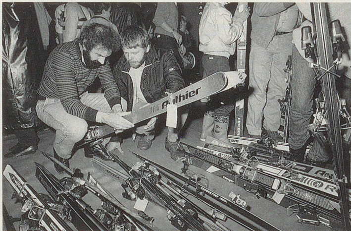
SUPFS: un engagement de «tous les jours».