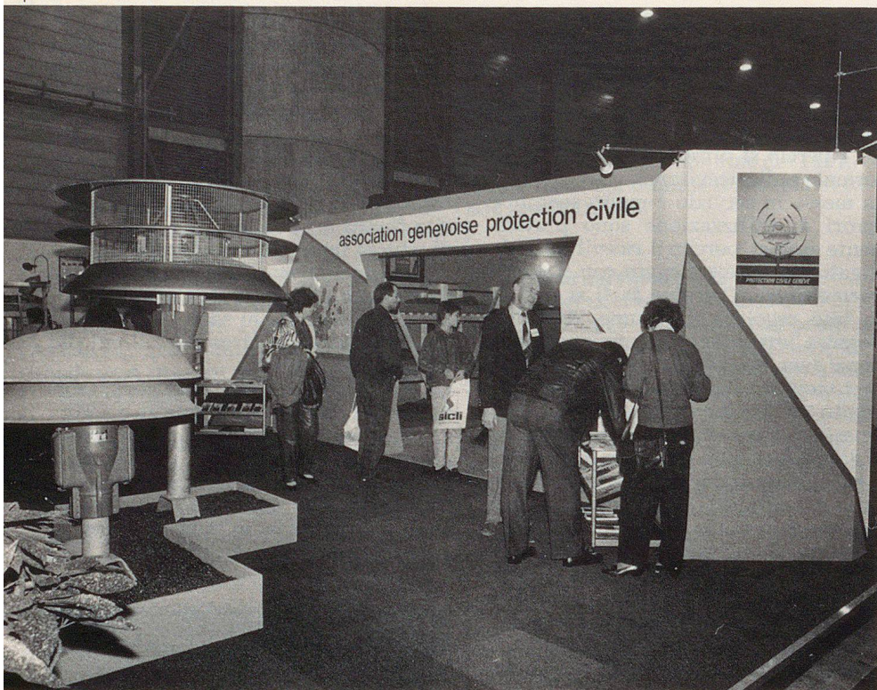
Un stand parlant de lui-même, une information claire et attrayante, les Arts Ménagers: une autre façon de faire connaître la protection civile.