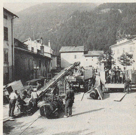
Die mitgebrachten Fahrzeuge erwiesen sich für den Abtransport von Schutt als äusserst nützlich.