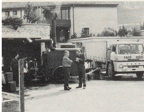
Drei Haushalteinheiten stellten die Verpflegung auf der mitgebrachten ZSO-eigenen Feldküche sicher.