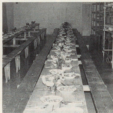
Die leerstehende BSA Poschiavo – sie stand ebenfalls unter Wasser – diente als Essraum.