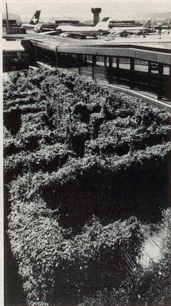
SOPRALENE EP 5.0 wh (antiracine) – étanchéité pour toiture-jardin. Garantie contre la pénétration des racines.

Les constructeurs doivent se prémunir des infiltrations. La meilleure solution est