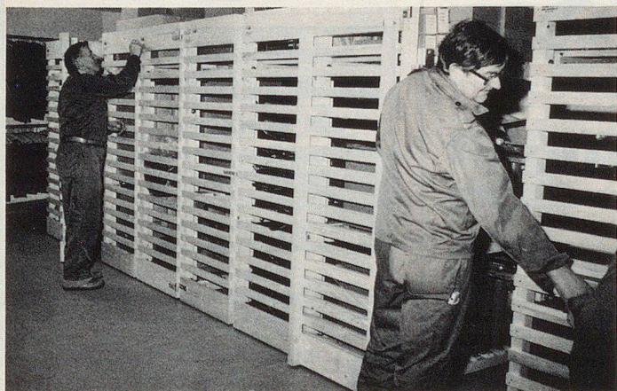
Vorläufig dienen sie noch anderen Zwecken, die «PLANZER 87»-Liegestellen.

Planzer Holz AG 6262 Langnau/LU Telefon 062 81 13 94