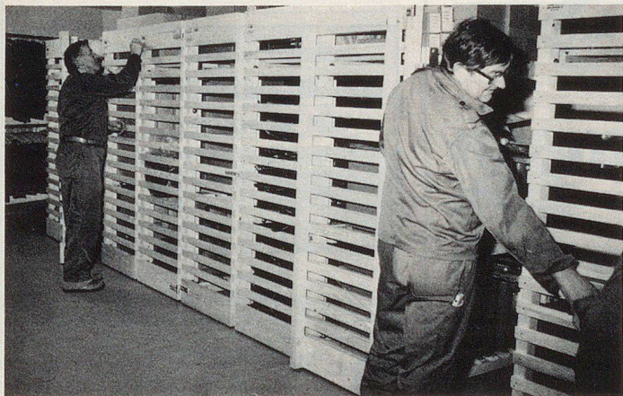
Vorläufig dienen sie noch anderen Zwecken, die «PLANZER 87»-Liegestellen.

Planzer Holz AG 6262 Langnau/LU Telefon 062 81 13 94