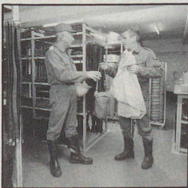
ZS-Ausrüstung nach Hause?