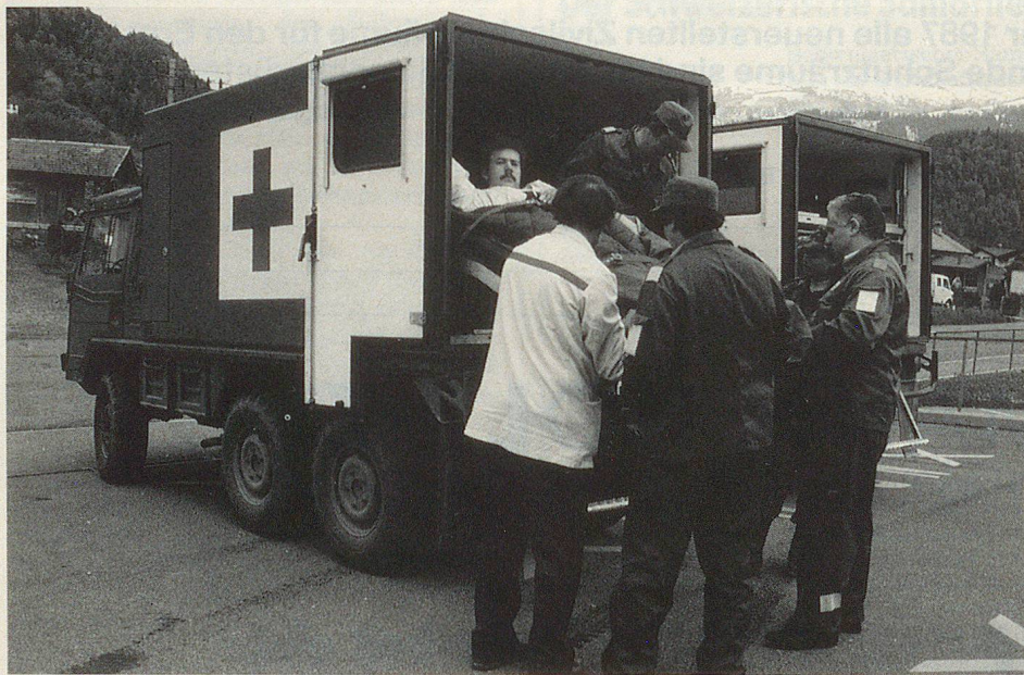
Les sections de samaritains font aujourd'hui partie intégrante de la santé publique suisse.

ASS. L'Alliance suisse des samaritains (ASS) célèbre en 1988 son centenaire. Dès sa création, l'ASS a recherché la collaboration de la Croix-Rouge suisse. C'est sur la base de cette relation, qui s'est étoffée au cours de quelque cent années, que l'Alliance suisse des samaritains est devenue en 1984 membre corporatif de la CRS. Fortes de 57 000 membres, les 1365 sections de samaritains font aujourd'hui partie intégrante de la santé publique suisse.