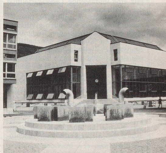
Centre de congrès de l'Université.