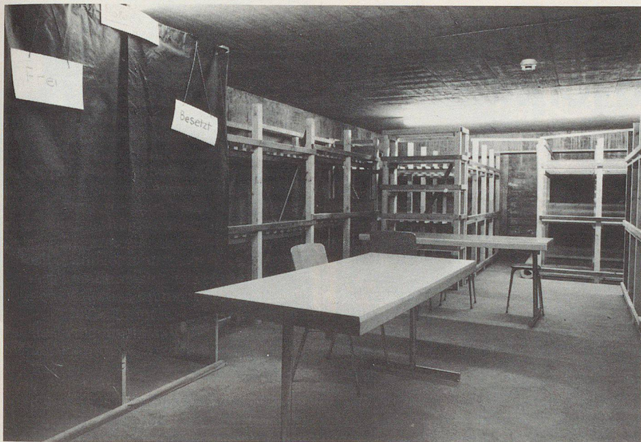
Depuis le 1er janvier 1986, tous les abris doivent être équipés de lits et toilettes de secours. Les lits qu'on trouve dans le commerce sont en bois ou en métal.

bitants de ces immeubles devront se rendre dans l'immeuble x situé dans la rue y. L'aide-mémoire de la protection civile qui figure dans les dernières pages des annuaires téléphoniques vous fournit de plus amples informations. Voilà un des systèmes envisageables pour faire connaître l'attribution des places protégées.