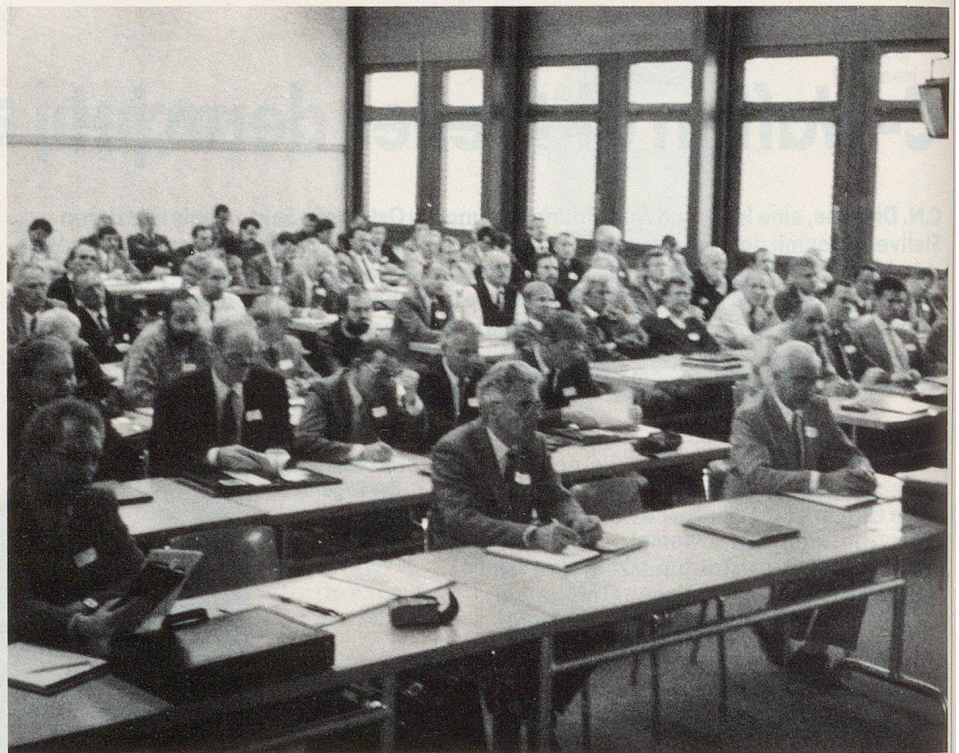
Intérêt manifeste de la part des commandants de protection civile venus des quatre coins de la Confédération.