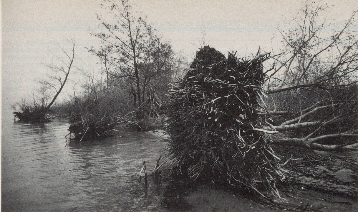
Das Schilfsterben am Bielerseeufer hat zu Erosionen geführt, denen selbst alte Bäume – wie hier in Mörigen – nicht mehr standhielten.