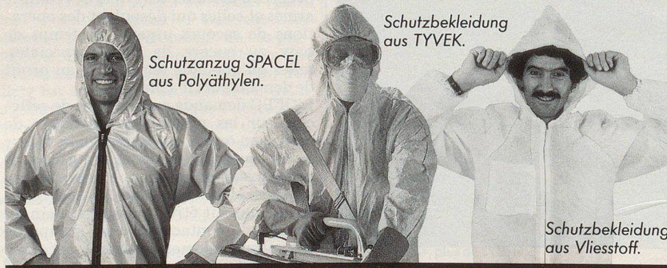
Schutzanzug SPACEL aus Polyäthylen.