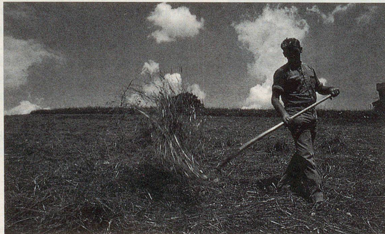
Wenn's kritisch wird, muss noch möglichst viel Futter eingebracht und geschützt gelagert werden.

Im Laufe der Zeit wurden zwar verschiedene Vorbereitungsmaßnahmen diskutiert, um schon in Friedenszeiten den Schutz unserer Nutztiere gegen Atom und Chemie vorzubereiten (siehe «Zivilschutz und Landwirtschaft: Keine Patentrezepte»). Weit sind solche