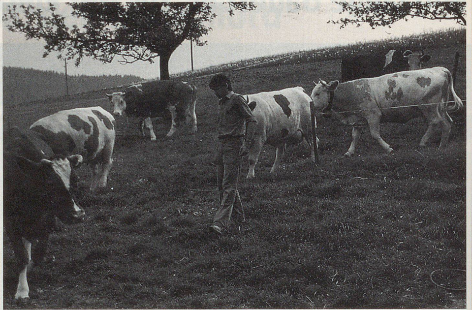
Im Ereignisfall ist das Vieh so rasch wie möglich in die Ställe zu treiben.

In Zeiten tiefen Friedens lässt sich wunderschön über ethische Fragen diskutieren. Ist es etwa gerecht, für die Menschen Schutzräume zu bauen und