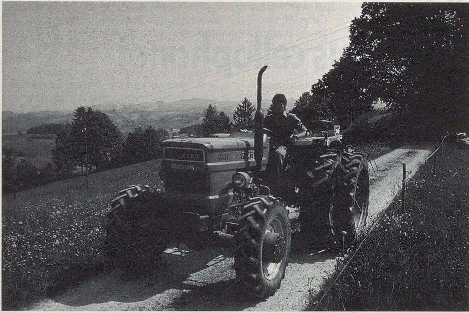
Im Gegensatz zu Pferden sind Traktore unempfindlich gegen Atom und Chemie.

Ideen in keinem Fall gediehen. Da war etwa der Vorschlag eines bekannten Veterinärs, man könnte die Bauerndörfer durch untertunnelte Umfahungsstrassen vom Verkehr entlasten – und im Ereignisfall dann die Tunnelabschnitte als Grossraumbunker für die Tiere benutzen (also eine Art Luzerner Sonnenbergtunnel, nur eben nicht für die Menschen, sondern fürs Vieh). Weniger exotisch waren Versuche mit atomsicheren Ställen. Neubauten sollten (mit Subventionen?) derart ausgelegt werden, dass sie einem gewissen Explosionsdruck standhalten können und auch die Tiere gegen radioaktive Verstrahlung schützen. Ein Experimentierstall wurde nach Weisungen des Eidgenössischen AC-Zentrums Spiez bei Lätterbach im Niedersimmental erstellt – das einzige Denkmal dieser technokratischen Art der Problemlösung. Die Phase schliesslich, wo propagiert wurde, die Kühe seien samt ihren Ställen in Plastik zu verpacken, gehört ebenfalls der Vergangenheit an. Heute herrscht beim Landwirtschaftszivilschutz der nüchterne Realismus: «Für die Tiere gibt es keine Schutzräume», erläutert Roland Kurath, «aber die modernen Ställe sind gar nicht so schlecht – wenn man die Fenster behelfsmässig abdichtet und genügend Futter gelagert hat, kann man das Vieh bei nicht allzu starker Verstrahlung über die Runden bringen.»