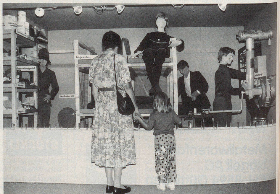
Die Bevölkerung im Schutzraum.