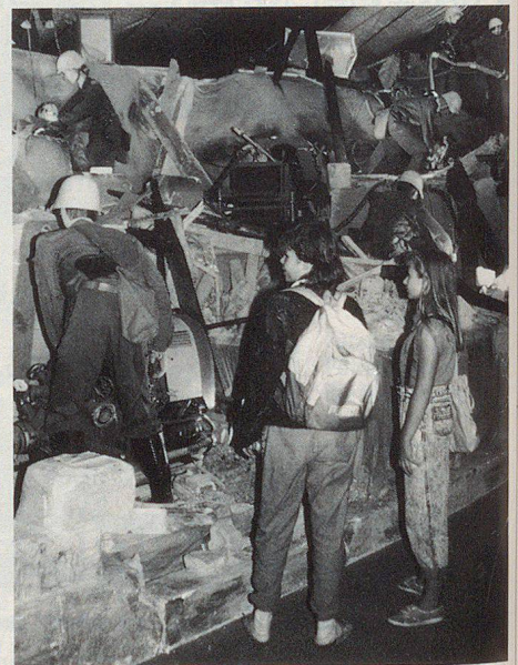
Der PBD im Einsatz wird bewundert.