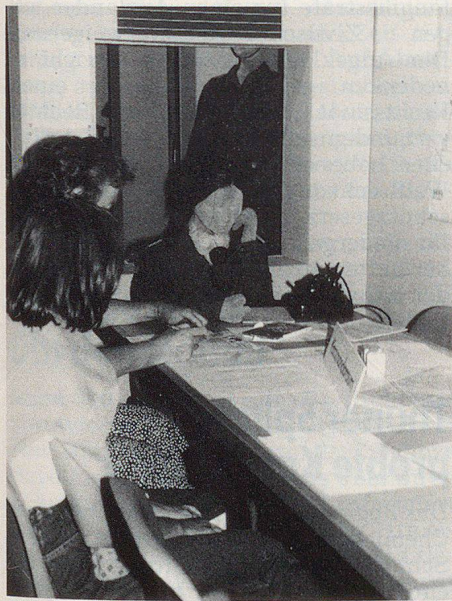
Blick in den Kommandorraum.