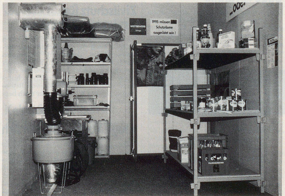
...und ein mustergültig aufgeräumter Schutzraum.

Durch diese Aktivitäten kamen nicht nur zahlreiche Zivilschutzinteressierte in den Genuss der Ausstellung, sondern es ergab sich in der Sonderschau auch täglich eine willkommene Präsenz von Zivilschutzleuten aller Art. Eine nachahmenswerte Idee!