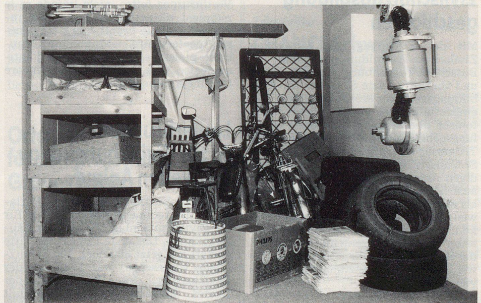
Ein chaotisch «ingerichteter»...