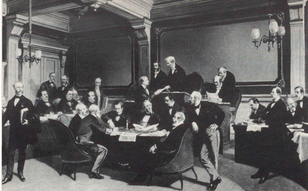
Diplomatische Konferenz von 1864.

Vor 125 Jahren, am 22. August 1864, haben 26 Vertreter von 16 Staaten in Genf auf Initiative des Internationalen Komitees vom Roten Kreuz (IKRK) die Idee Henry Dunants in die Tat umgesetzt und das erste Genfer Rotkreuz-Abkommen zur Verbesserung des Loses der verwundeten Soldaten der Armeen im Felde abgeschlossen.