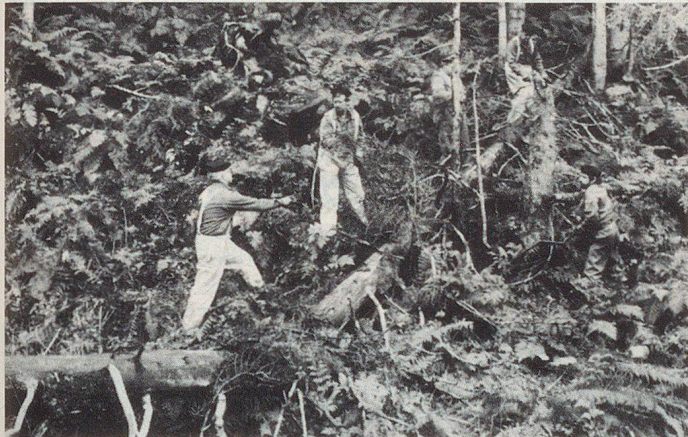
Für die meisten Zivilschützer gab es ungewohnt harte Arbeit zu verrichten.