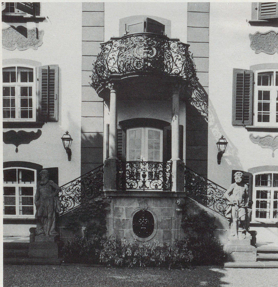
Molte case di ricchi borghesi testimoniano l'amore per l'arte dei loro costruttori. La casa barocca «zur Linde», costruita nel 1764, venne completata nel 1918 da una scala all'aperto, una balaustra in ferro battuto e due statue in piena armonia con il suo stile.

Vista dall'insieme più vasto della protezione civile, la protezione dei beni culturali è un servizio speciale piuttosto piccolo. La più piccola formazione è formata di due persone, mentre nelle città e nelle grandi organizzazioni di protezione possono essere anche più di una dozzina di specialisti. Anche se il fabbisogno di personale è senz'altro controllabile, non si riesce sempre a incorporare persone idonee o a rilevarle da altri servizi. Per questo siamo lieti del fatto che i programmi d'istruzione e i documenti disponibili ammettano un vasto spettro di personale da reclutare. ▽