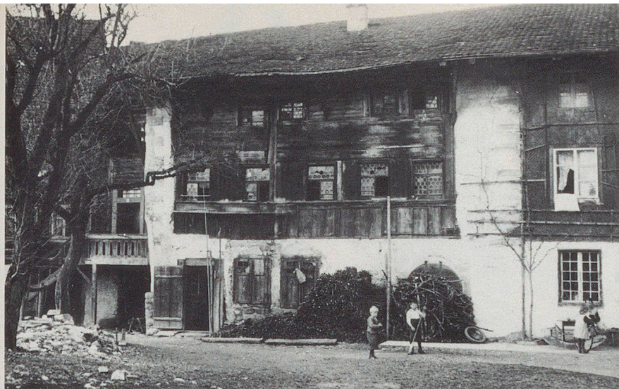
Della cittadina di Meienberg nel Freiamt (oggi comune di Sins) ci è rimasta solo la sede di uffici, testimonianza di una comunità nel 13° secolo. Le foto mostrano lo stato precedente e quello successivo al restauro avvenuto nel 1953.