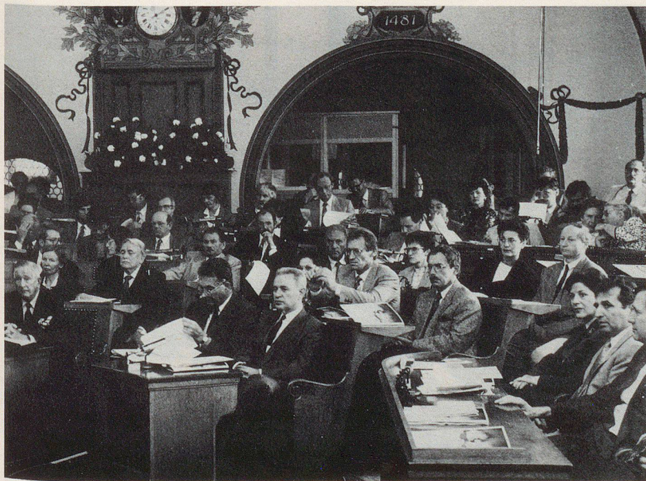
L'assemblée plénière était constituée de tous les groupes d'intérêt.

Les intentions poursuivies par l'initiative dite pour une Suisse sans armée mettent ces efforts en question. Elles reviennent à renoncer à notre indépendance, ce qui n'est dans l'intérêt de personne. Et surtout pas du maintien de la paix. C'est justement pourquoi l'Union suisse pour la protection civile rejette l'initiative en cause.