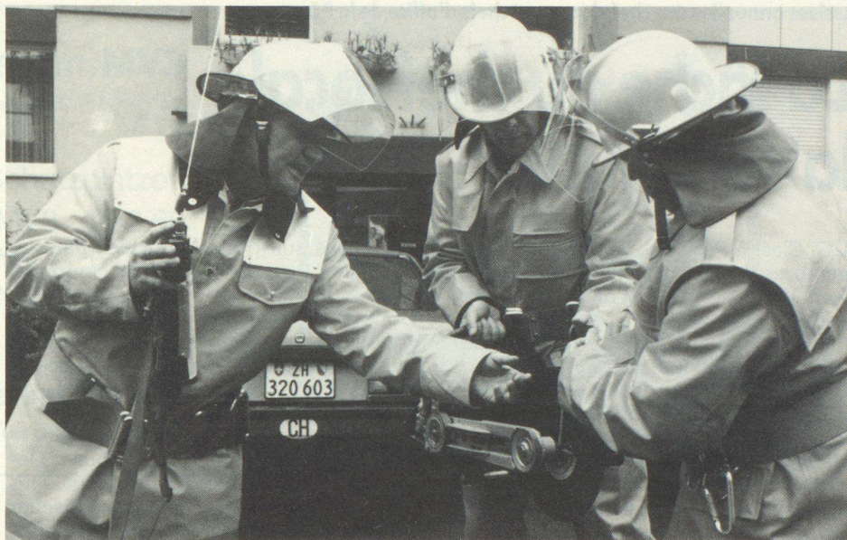
Der Zivilschutz-Nothilfe-Zug ist innert einer Stunde einsatzbereit.

Die dritte Stufe umfasst die ganze örtliche Schutzorganisation (OSO und SRO). Die 22 Betriebsschutzorganisationen sind bewusst nicht in der Nothilfeorganisation enthalten, da einerseits viele dieser BSO-Angehörigen in den Betriebsfeuerwehren eingeteilt sind und andererseits diese wichtigen Betriebe im Katastrophenfall nicht weiter geschwächt werden sollen. Diese 3. Stufe sollte jedoch nur im Extremfall aufgeboten werden müssen. Das Aufgebot würde per Post-Express verteilt (evtl. durch Radiodurchsage unterstützt). Mit der Einsatzbereitschaft ist nicht vor 36 Std. zu rechnen. Selbstverständlich sind wir uns be-