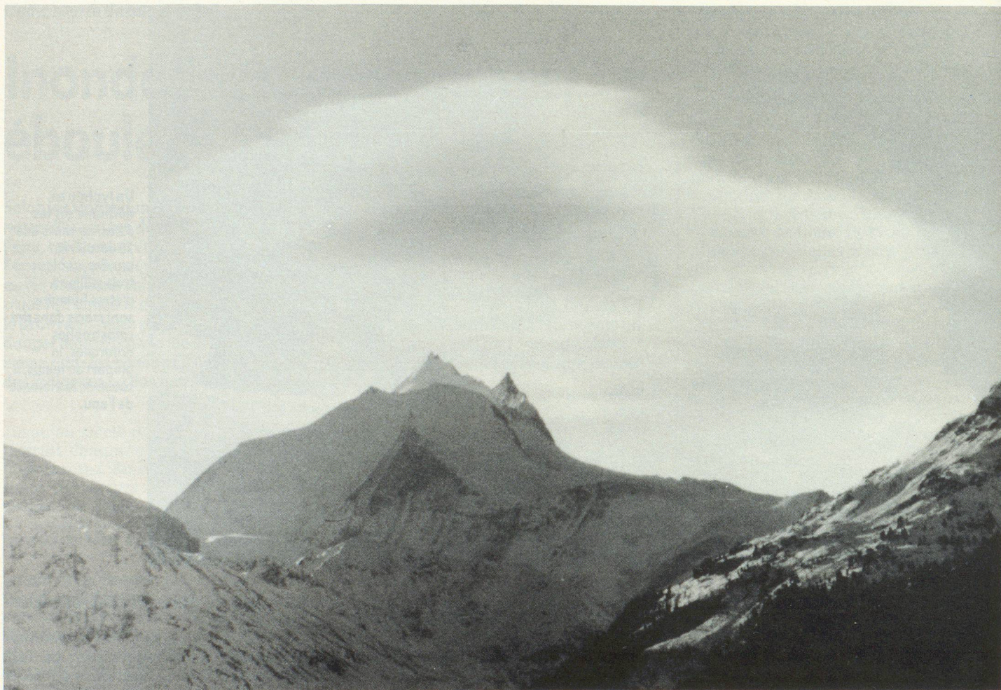
Nuvole di favonio sulle montagne innevate: una situazione pericolosa per la caduta di valanghe.