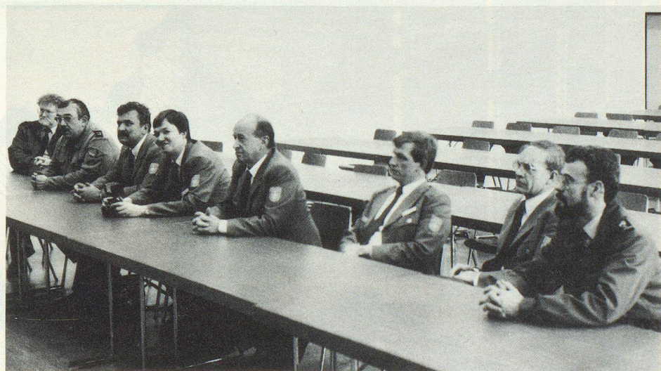
Interesse am schweizerischen Zivilschutz: Angehörige des deutschen Katastrophenschutzes THW.

Neben Katastropheneinsätzen im eigenen Land halfen Angehörige des THW in den letzten Jahren vor allem in den Katastrophengebieten von Mexiko, Ecuador, Somalia und Armenien. ▀