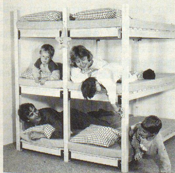
WISTHO-Schutzraumliegen sind 100% schweizerisch: Holz, Patent, Verarbeitung, Vertrieb