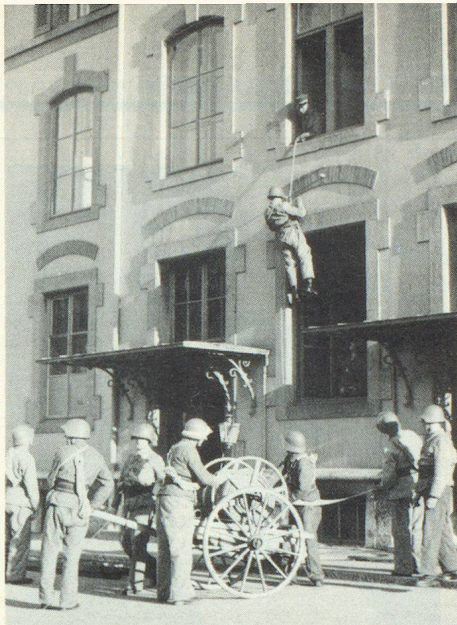
Rettungsübung des blauen Eisenbahnlufschutzes im Jahre 1950.

Jede der 93 Organisationen erhält jährlich eine im voraus festgelegte Quote an Übungstagen zugeteilt. Der Betriebswehr-Kdt und der SRC jeder einzelnen Organisation sind verpflichtet, die Übungen rechtzeitig zu organisieren