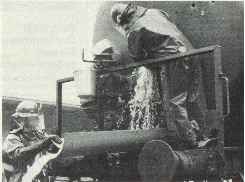
Betriebswehr im Einsatz mit dem Lösch- und Rettungszug.