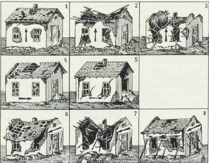
Les tremblements de terre sont plus particulièrement dévastateurs pour les maisons construites selon des méthodes anciennes.

La carte des menaces de séismes en suisse se subdivise en quatre zones, à savoir: zone 1: risque faible; zone 2: risque modéré; zone 3: risque moyen; zone 4: risque élevé.