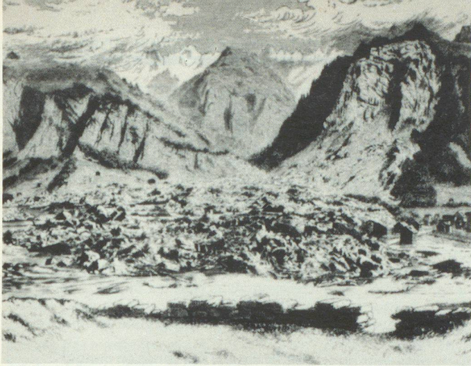
Le glissement de terrain survenu à Elm, dans le canton de Glaris, le 11 septembre 1881: 115 personnes ont perdu la vie sous des masses de rochers qui se sont décrochés du Plattenberg à la suite de l'exploitation inappropriée d'une mine d'ardoise.