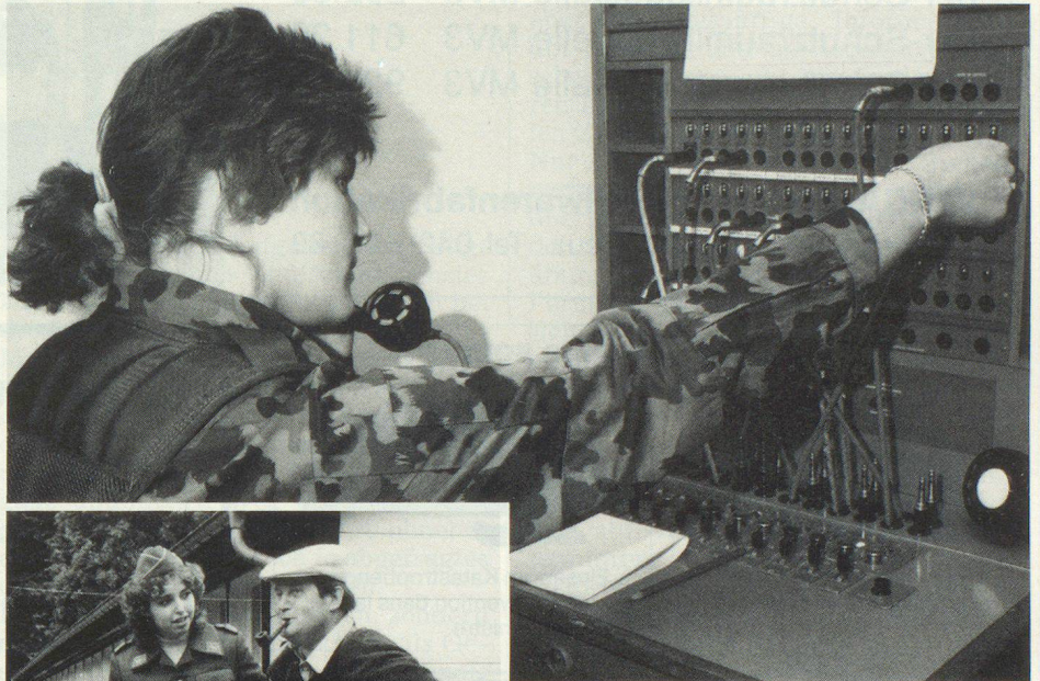
Frauen im Dienst der Armee: Bald neue Einsatzmöglichkeiten und vertiefte Fachausbildung.