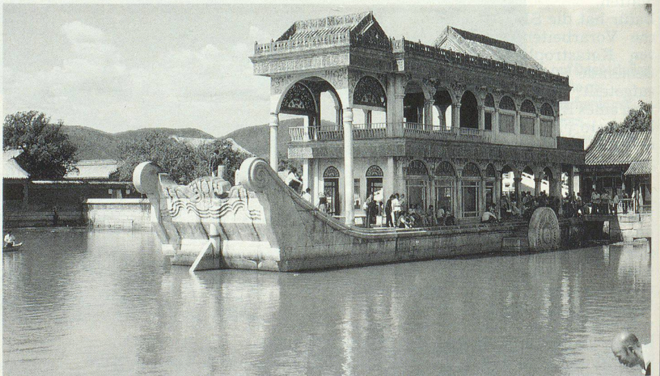
Das «steinerne Schiff» im Sommerpalast von Peking.

Eine Überraschung bildet die ungeheure Stille, die in der Anlage herrscht. Zu Beginn hörten die Besucher ein tiefes Summen der Ventilationsanlage, das jetzt aber verstummt ist. Hier unten ist eine Welt für sich. Man befindet sich jetzt in einer Präsentationshalle, auf deren Errichtung die Chinesen stolz sind. Auch hier überall «Rauchen verboten». Auf Gestellen stehen zugedeckte Modelle von Tunnelsektionen. Der Führer erzählt, dass er ein Ladenbesitzer sei. Die Bewohner jedes Abschnittes kennen den nächstgelegenen Eingang. Um eine mögliche Verwirrung