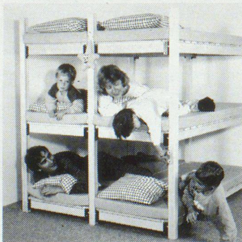
WISTHO-Schutzraumliegen sind 100% schweizerisch: Holz, Patent, Verarbeitung, Vertrieb