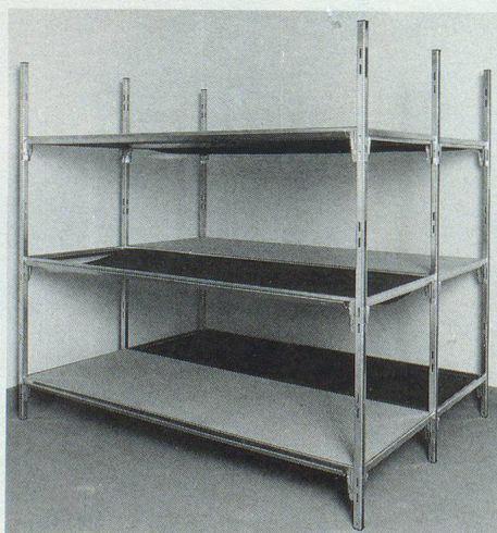
Die Schutzraumliegestelle für alle Fälle