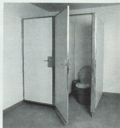
Abort-Kabinen und Trocken-Klosett-Ausrüstungen