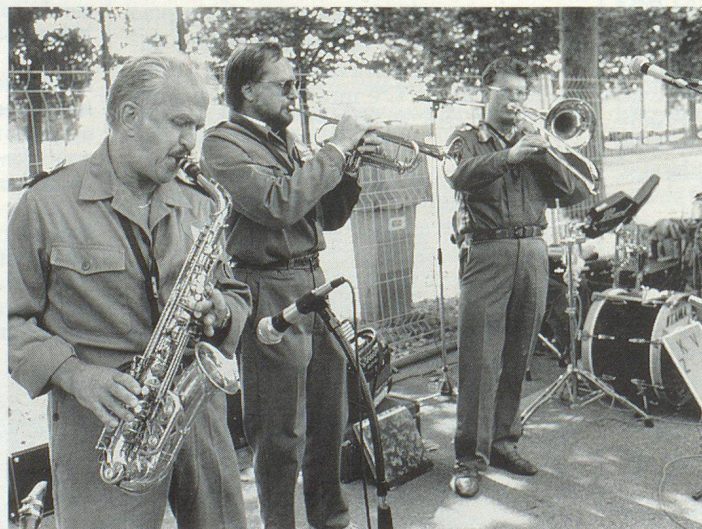
Die Zivilschutzkader-Band Ostermundigen spielte zur Matinee auf.

Bei der Veranstaltung ging es darum, die Leistungen von Männern und Frauen der Miliz im Dienste der Ge-