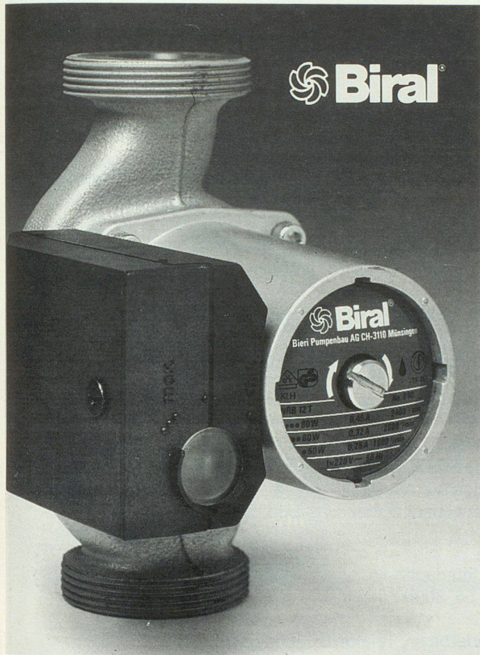
Eine der kleinsten Umwälzpumpen von Biral – bereits seit Jahren SEV-geprüft.