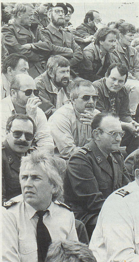
Anche il pubblico ha molto caldo.