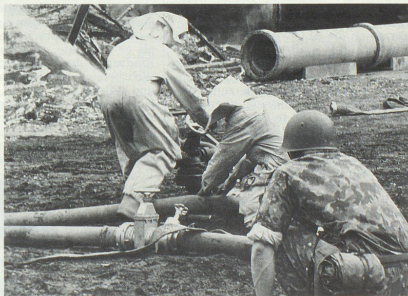
La protezione aerea in azione con i suoi potenti getti d'acqua.