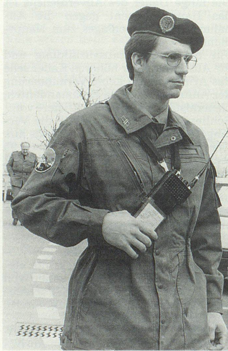
Geändert hat auch das äussere Erscheinungsbild: ein Festungswächter in der neuen Uniform.