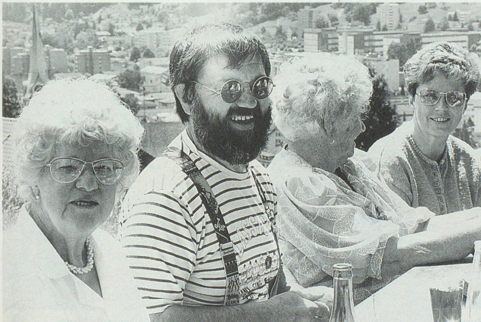
Kontakt zwischen Zivilschützern und Senioren.