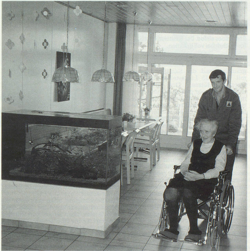
Der Einsatz der Zivilschützer brachte Abwechslung in den Alltag der Altersheimbewohner.

Ein spezielles Programm führte der Sanitätsdienst im Altersheim «Gosmergart» durch. Erstmals wurde nach theoretischer Vorbereitung eine zweitägige praktische Übung mit pflegebedürftigen Menschen realitätsnah durchgespielt. Unter Anleitung des Pflegepersonals wurden alltägliche Arbeiten in den Bereichen Körperpflege und Patientenbetreuung ausgeführt. Abwechslung in den Alltag der Heimbewohner brachte der Ausflug nach Isleten, einem beliebten Ausflugsort am Urnersee. Auch ein Besuch im Tell-