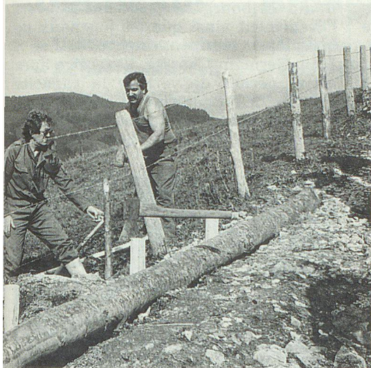
Etayage du chemin... attention les doigts semble dire l'ancien champion cycliste Auguste Girard (à gauche).