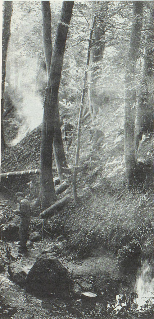
Ruisseau du Crozet: travail difficile dans la pente et la fumée.

demandent les personnes âgées, après avoir suivi une journée complète de cours dispensé par le personnel infirmier.