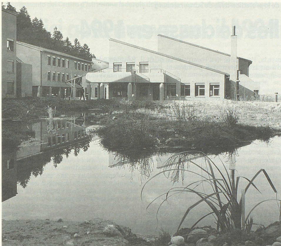
Das eidgenössische Zivilschutz-Ausbildungszentrum in Schwarzenburg.

den alle wesentlichen räumlichen und unterrichtsrelevanten Voraussetzungen für eine einheitliche und zielgerichtete Ausbildung vorhanden sein, um die Schulung der oberen Kader, die Ausbildung von Spezialisten technisch aufwendiger Dienste und die zentrale Schulung der Instruktoren des Bundes, der Kantone und der Gemeinden sicherzustellen. In Anbetracht der bisherigen und der zu erwartenden Mietkostenentwicklung und unter Berücksichtigung der nutzbaren eigenen Landreserven ist es für den Bund längerfristig wesentlich wirtschaftlicher, die dem BZS anfallenden Instruktionendienste in eigenen Räumlichkeiten durchzuführen. Bundeseigene Ausbildungsanlagen garantieren – im Gegensatz zu Mietobjekten – die gewünschte Unterbringungs- und Durchführungssicherheit. Ferner werden durch die Zentralisierung Dislokationen mit Motorfahrzeugen während der Kursdauer auf ein Minimum beschränkt.