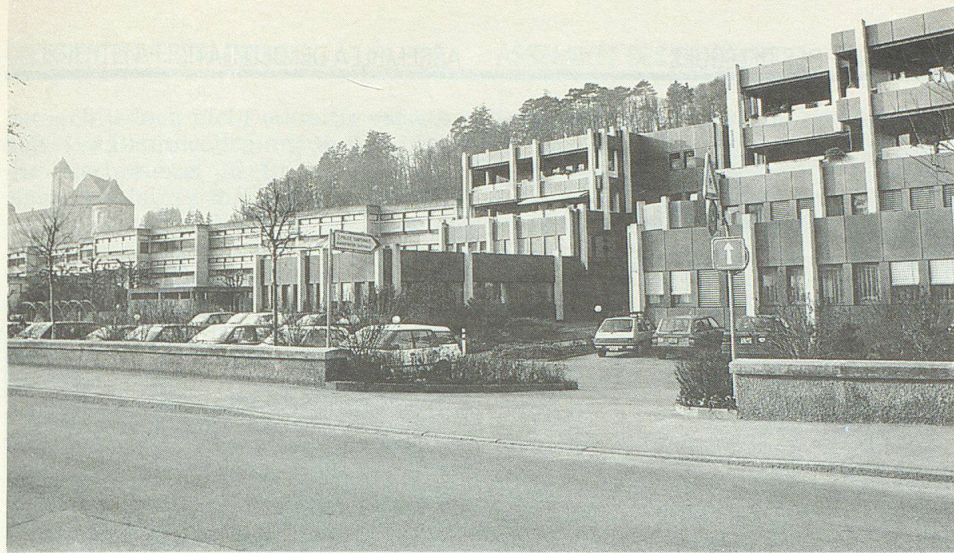
L'administration cantonale, à Porrentruy, abrite le bureau de la protection civile.