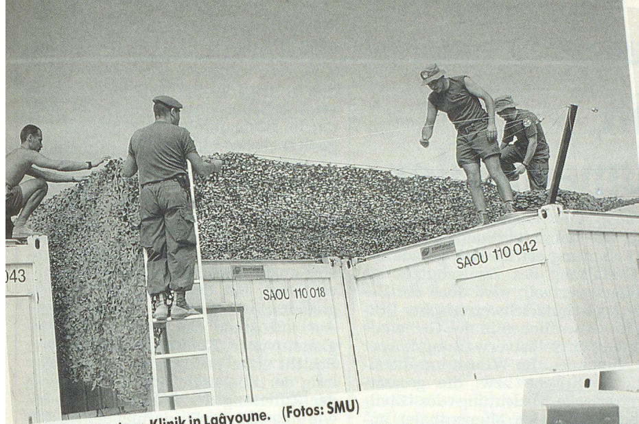
Aufbau der Container-Klinik in Laâyoune.