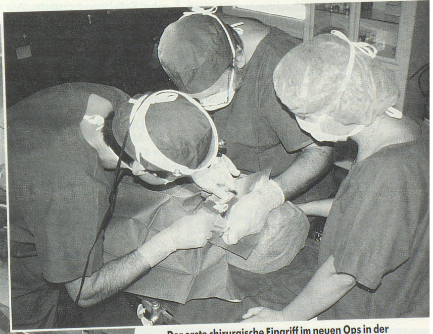
Der erste chirurgische Eingriff im neuen Ops in der Klinik Laâyoune.

sprachen sind an der Tagesordnung. Doch auch daran kann man sich gewöhnen. Kopfzerbrechen gibt es nur dann im Küchendienst, wenn es darum geht, Frischwaren einzukaufen. Milchprodukte müssen via Agadir bestellt werden. Manchmal sei die Butter grau oder blau, so Cotti, da die Kühlkette nicht immer ohne Unterbruch funktioniert. Das Fleisch wird ebenfalls in Laâyoune eingekauft. Die Küchenchefs suchen sich auf dem Markt ein geeignetes Tier aus. Der lokale Metzger besorgt den Rest. Das Präparieren des Fleisches jedoch ist wieder Sache der SMU-Küche. Doch die Erfolge sprechen für sich; seitdem der Küchencontainer in Agadir freigegeben worden ist und die SMU sich selbst verpflegen kann, sind die eigenen Fälle von Amöbenerkrankungen drastisch zurückgegangen. Und das Resultat darf sich in