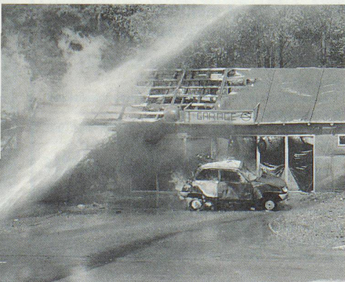
Das Feuer greift explosionsartig auf ein Nachbargebäude über.