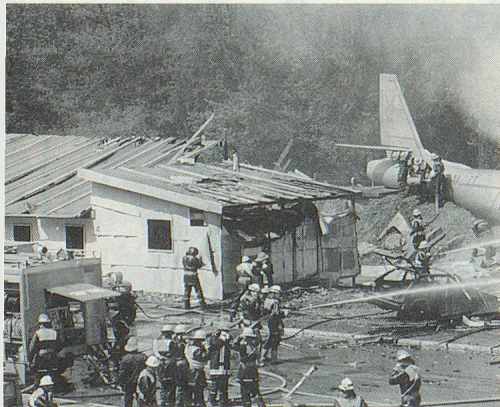
«Retten, halten, löschen», heisst es für die in rascher Folge aufgebotenen Rettungsformationen.