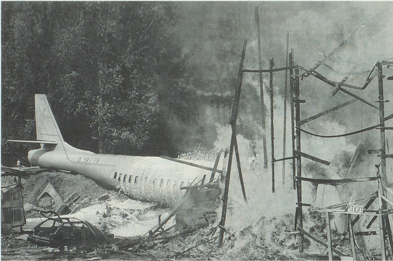
Der Absturz einer Maschine der «Crash Air» setzt das Hotel «Tell» in Vollbrand.