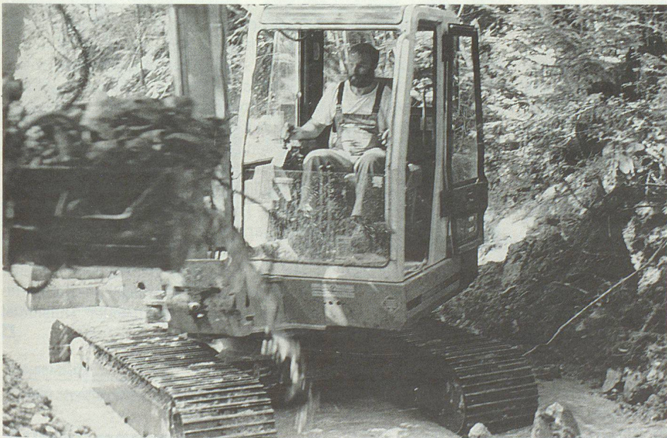
Die Bachläufe werden vom Geschiebe befreit.

Als erstes wurde in einem erst vor wenigen Jahren erbauten Quartier die Einstellhalle überflutet und ein rundes Dutzend Personenwagen versanken in den Wassermassen. Die Keller von Privathäusern, die sich mit Wasser füllten, waren bald nicht mehr zu zählen. Auch das Untergeschoss des neuen Inwiler Schulhauses wurde überflutet. Der Proberaum der Musikschule, Werk- und Bastelräume samt Mobiliar und das Gemeindearchiv mit vielen unersetzlichen Schriften wurde von den Wassermassen fortgeschwemmt.