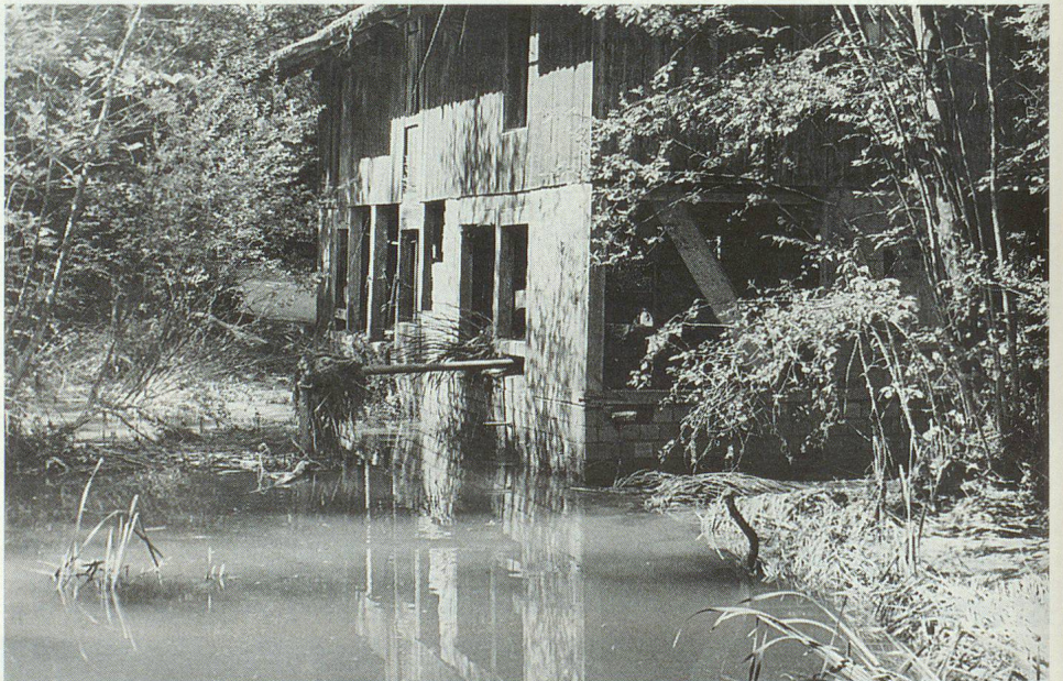
Noch nach Tagen ist das Wasser zu kleinen Seen aufgestaut.