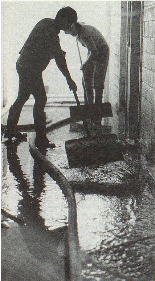
Das Schlimmste ist geschafft. Hier wird nur noch «Feinarbeit» geleistet.

Bis unter die Decke war das Parterre- geschoss des alten Schulgebäudes mit Wasser voll- gelaufen.