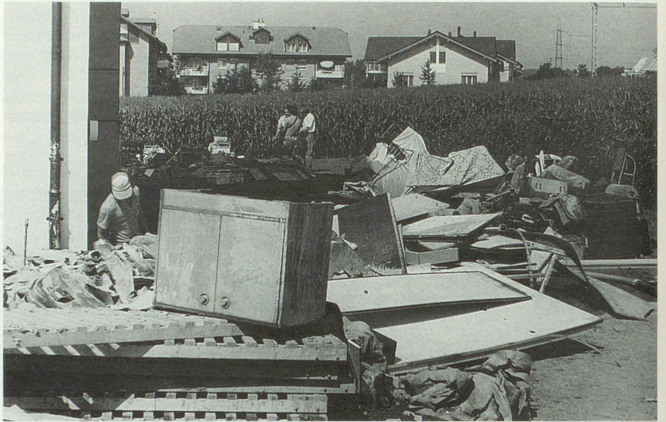
Nach dem Unwetter türmen sich Abfallberge vor den Häusern.

Auch andere Gebiete des Kantons Luzern waren heimgesucht worden. Doch die Gemeinde Inwil hatte es besonders stark getroffen. Innert weniger Stunden fiel ein Zehntel der üblichen Jahresniederschlagsmenge. Die Kanalisation vermochte die Wassermassen nicht mehr zu schlucken und die Bäche, mit Geschiebe, Astwerk und Bäumen verstopft, traten über die Ufer.