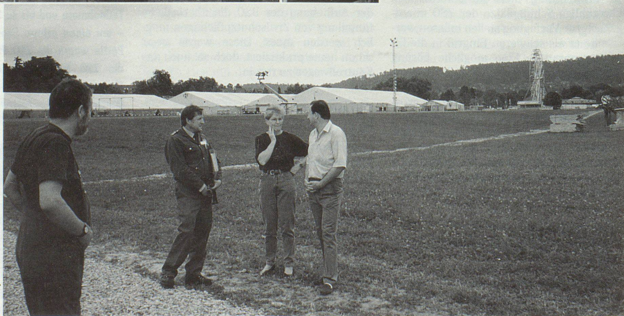
Der Regen setzte dem weiten Festgelände arg zu. Vermehrte Arbeit für den Zivilschutz!