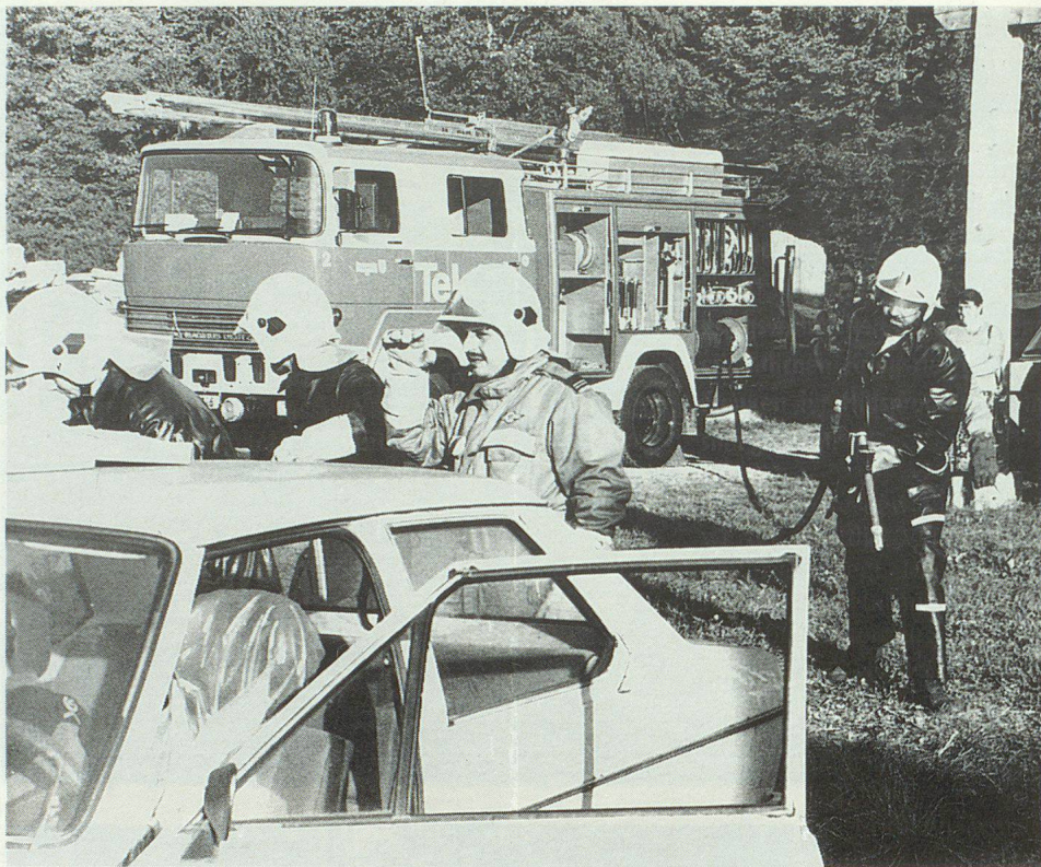
Rettung zweier eingeklemmter Personen aus dem total demolierten Fahrzeug.

Im Anschluss an die theoretischen Ausführungen folgten die Teilnehmerinnen und