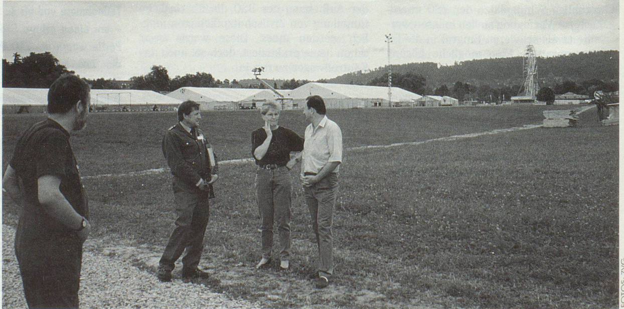
Der Regen setzte dem weiten Festgelände arg zu. Vermehrte Arbeit für den Zivilschutz!