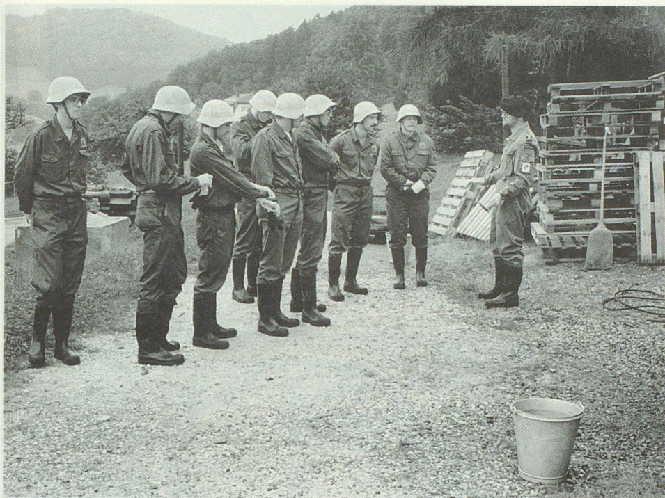
So ein grosser Haufen Holz und so ein kleiner Kessel?