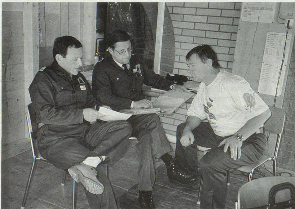
Lagebesprechung. Gute Organisation war die Voraussetzung für den Erfolg des Einsatzes.

Die Motivation fast aller Angehörigen der beiden ZSO war sehr gut, und die Freude an der Leistung und am Funktionieren der Anlagen spürbar. Vertreter der Projektleitung betonten denn auch, dass derartige Übungen sowohl in fachtechnischer als auch in psychologischer Hinsicht einer ZSO gut tun. Aber auch für die Kaderangehörigen war der Anlass sehr lehrreich, zeigte sich doch immer wieder, dass Planung und praktischer Einsatz zwei sehr verschiedene Dinge sind. Besonders die Anpassung an sich ständig ändernde Randbedingungen war immer wieder gefordert, etwa wenn sich zeigte, dass der Aufwand für eine bestimmte Arbeit falsch eingeschätzt worden war oder Dinge erledigt werden mussten, an die man vorher nicht gedacht hatte. Auch das ausnehmend schlechte Wetter stellte die Organisatoren vor grosse Herausforderungen, mussten doch die Wege neu geplant und Holzschnitzel geschüttet werden, da sich das Gelände sonst in einen Morast verwandelt hätte. Um die zahlreichen Aufgaben zu bewältigen und die unbedingt erforderliche Koordination und gegenseitige Information sicherzustellen, erwies es sich dabei als sehr hilfreich, jeden Nachmittag einen Rapport durchzuführen, an welchem die Einsätze des folgenden Tages besprochen wurden. ▽