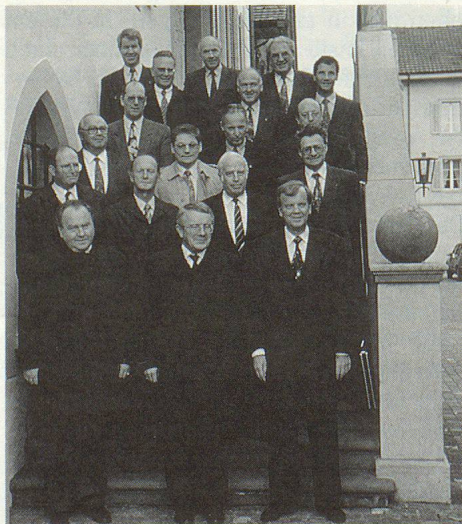
Les conseillers d'Etat chargés de la PCi devant l'Hôtel de Ville à Sarnen.

La sécurité intérieure du pays comprend l'ensemble des mesures propres à assurer l'ordre et la protection de l'Etat. Elle n'implique pas seulement la lutte contre la criminalité, mais également l'aide en cas de catastrophes d'origine naturelle ou techni-