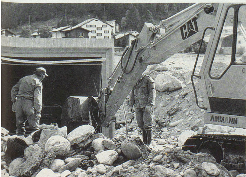
La PCI dégage un garage...

On articule, pour l'ensemble de la vallée, le chiffre de 60 millions de francs de dégâts. Mais ce n'est encore qu'une estimation.