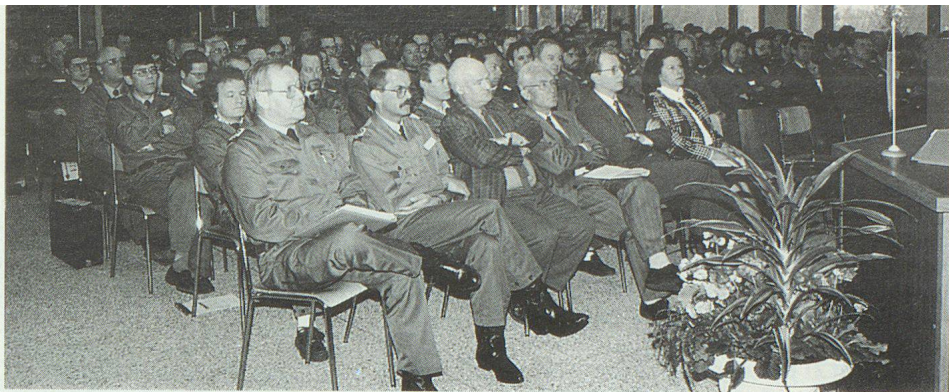
Plus de 180 cadres supérieurs de l'OPC ont participé à cette journée d'information.